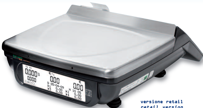
versione retail retail version