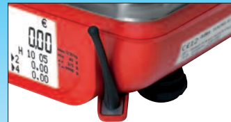
Radio frequenza wireless